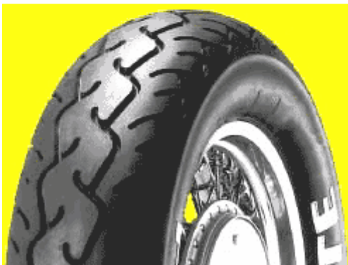
MT 66 ROUTE post.