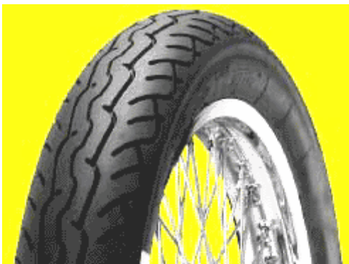
MT 66 ROUTE ant.